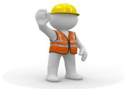
Complejo de Bodegas Almagro SISTEMAS DE ILUMINACION